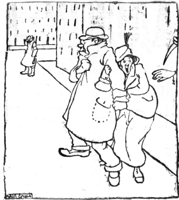
Пара на улице сталкивается с безвыходной ситуацией. «Ужас! Сзади грабитель, впереди милиционер!» 8